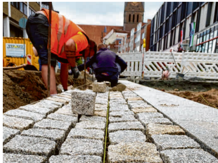
Straßenbauarbeiten stehen auf einer Baustelle in Hannover an.