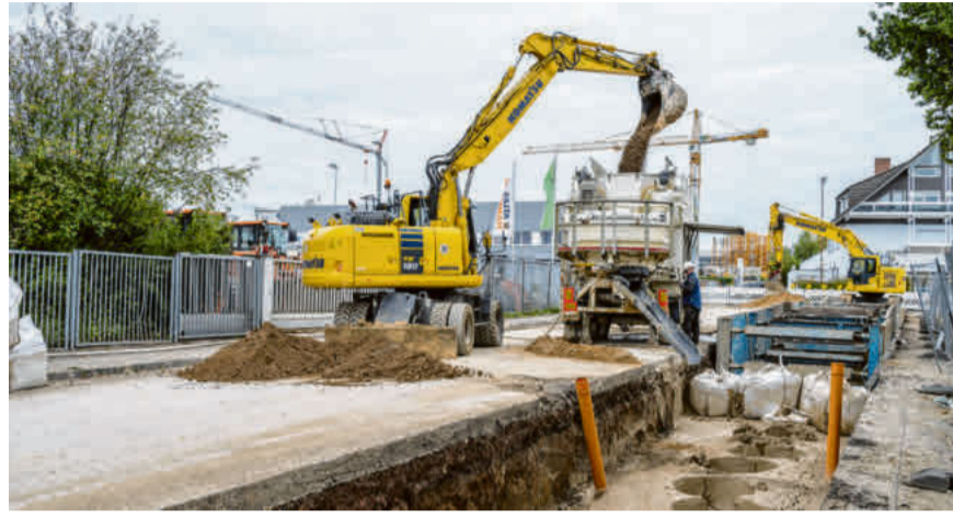
Die Firma Staatz ist im Einsatz am Celler Schützenplatz und in Laatzen.