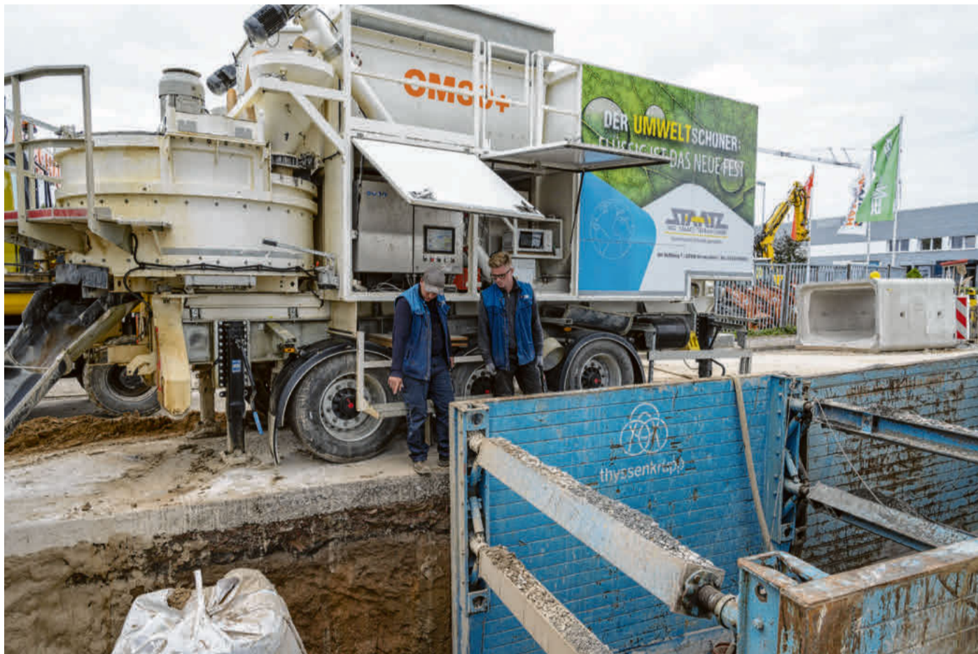
Der Kanalbau wird mit einer umweltschonenden Flüssigbodenanlage umgesetzt.

Des Weiteren analysiert der Tiefbauexperte in der Kanalsanierung Schäden mit moderner Technik, um diese anschließend